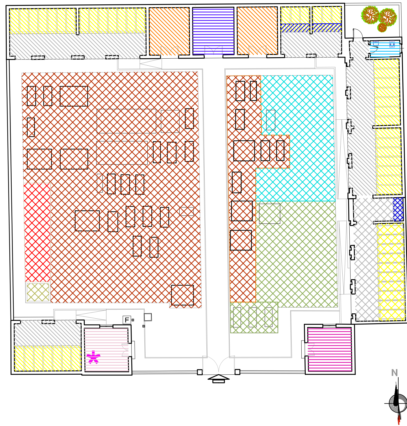
CIMITERO DI POZZAGLIO